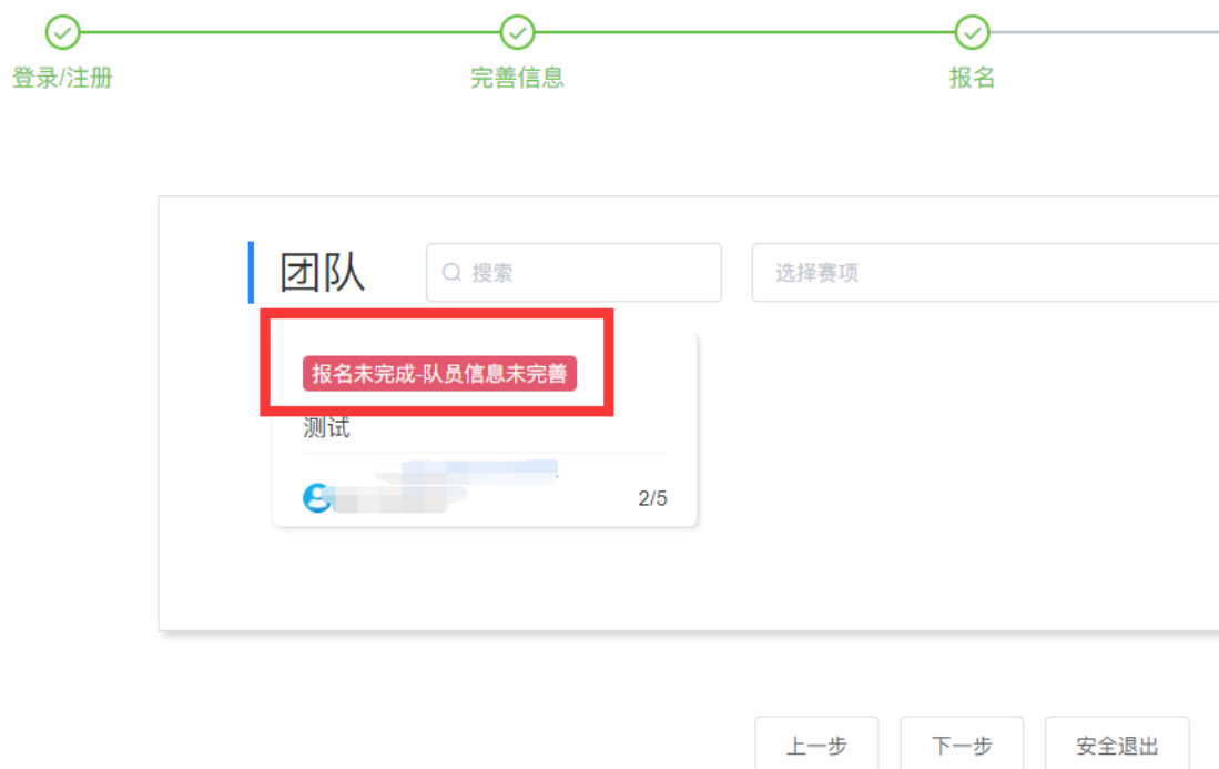
图 7 团队状态