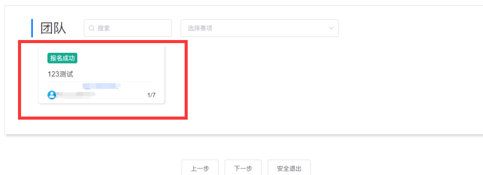
图 9 团队成员管理入口