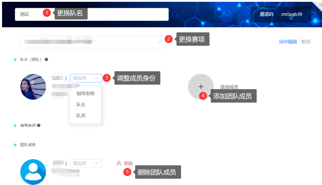
图 11 团队编辑操作页面