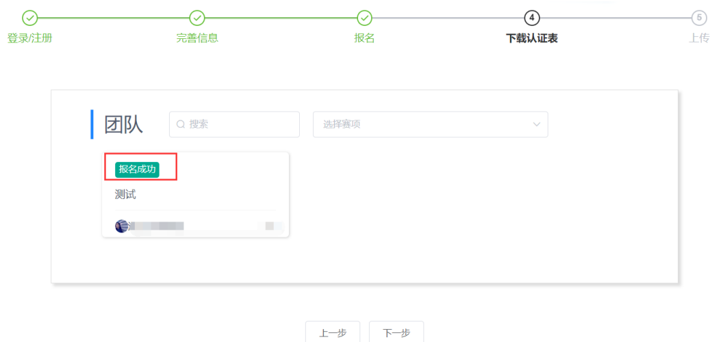
图 8 报名成功