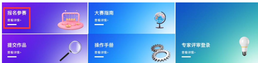
图 1 竞赛报名入口

(1) 注册登录：先注册（请用手机号注册），后登录；若已有账号，直接点击账户登录，图 2 显示了用户注册入口，图 3 显示了用户登录入口。